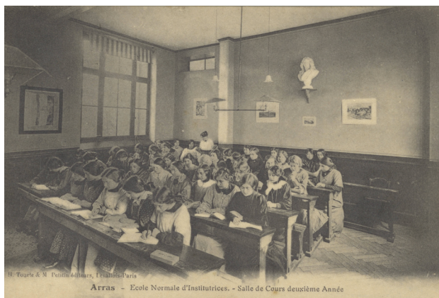
Archives départementales du Pas-de-Calais, 062_38fi_1115_0001

Renseignements et réservations : 03 21 21 47 28 ; longuevergne.elodie@pasdecalais.fr