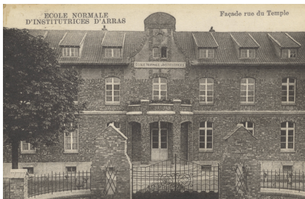
Archives départementales du Pas-de-Calais, 062_38fi_1114_0001