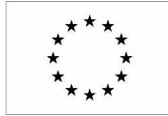
Version noir et blanc